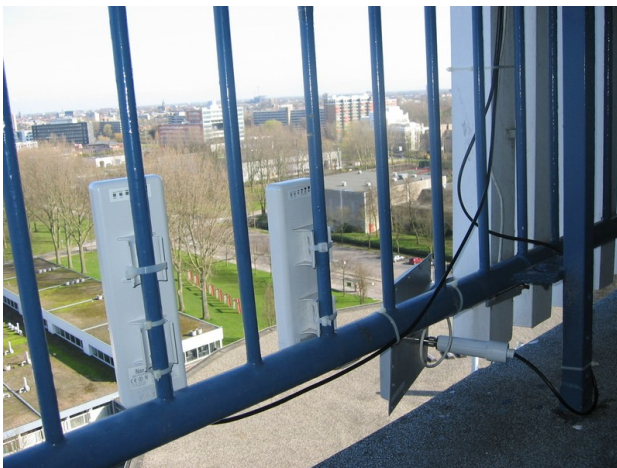
Antenne op wit gebouw (Universiteitsgebouw van Leiden)