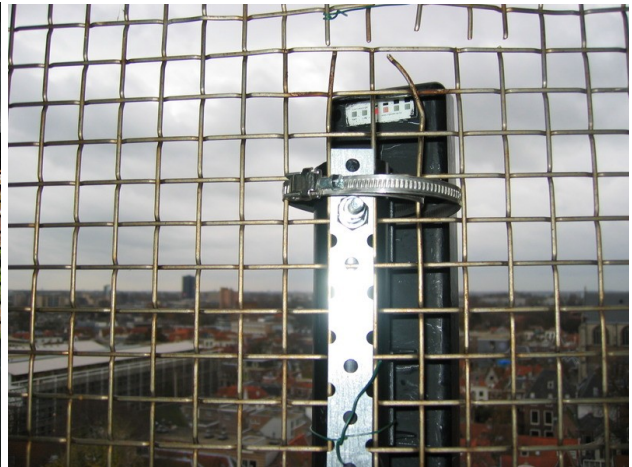
Antenne op Stadhuis van Leiden