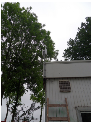
Voorbeeld van een laag punt (PV de Kerkduif).