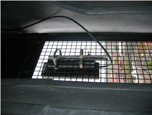
Gecamoufleerde antenne in Pieterskerk.