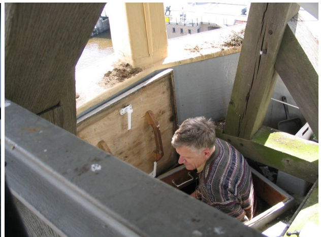
Vrijwilligers bouwen en onderhouden de apparatuur.