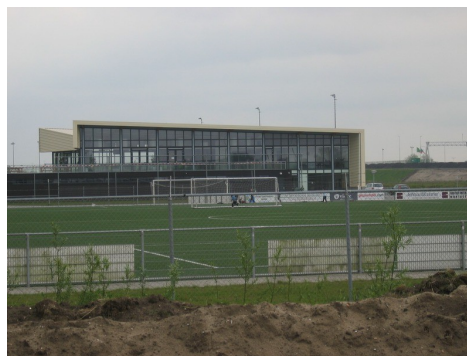
Voetbal vereniging Meerburg is ook een laag punt (de antenne's zitten onder de nok).